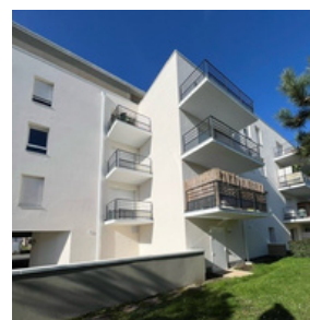
Ravalement de façade de la résidence les Terrasses de Thouaré à Thouaré-sur-Loire

pour la mise en copropriété et gestion d'immeubles neufs